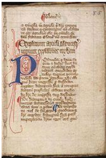
Magna carta cum statutis angliae ( Magna carta con gli Statuti Inglesi ), inizio del XIV secolo.

Durante il regno di Edoardo III vennero emessi, tra il 1331 e il 1369, i Sei Statuti , dei documenti concepiti per tentare di chiarire alcune parti delle Carte. In particolare il terzo statuto del 1354, ridefinì la clausola 29, modificando "uomo libero" con "nessun uomo, di qualsiasi Stato o condizione che egli possa essere" e introdusse la frase "procedura prevista dalla legge" per il "giudizio legale dei suoi pari o la legge della terra". [113]