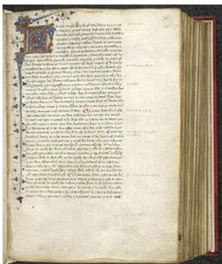
Una copia della Carta del 1217, stampata tra il 1437 e il 1450 circa.

Nel corso del XVI secolo si modificò l'interpretazione della Magna Carta e della guerra dei primi baroni. [118] Enrico VII prese il potere alla fine dei disordini conseguenti alla guerra delle due rose , a cui seguì Enrico VIII d'Inghilterra ; entrambi si prodigarono nel promuovere la legittimità del trono e di rendere illegale qualsiasi tipo di ribellione contro il potere reale. [119] Da sovrana assoluta per diritto divino , Maria I volle ripristinare un'Inghilterra cattolica con una spietata repressione dei protestanti.