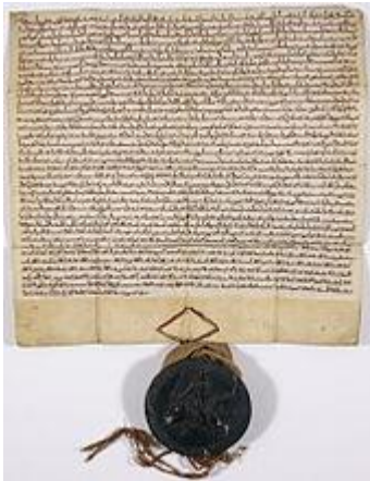
La Carta della Foresta, 1217, conservata presso la British Library .

Nel mese di febbraio 1217, Luigi salpò per la Francia per radunare rinforzi. [63] In sua assenza scoppiò una disputa tra i seguaci francesi di Luigi e quelli inglesi, mentre il cardinale Guala dichiarò che la guerra di Enrico contro i ribelli era l'equivalente di una crociata religiosa. [64] Questa dichiarazione provocò una serie di defezioni nel movimento ribelle e le sorti del conflitto volsero in favore di Enrico. [65] Alla fine di aprile Luigi fece ritorno, ma le sue forze del nord furono sconfitte il mese seguente da Guglielmo il Maresciallo nella battaglia di Lincoln . [66]