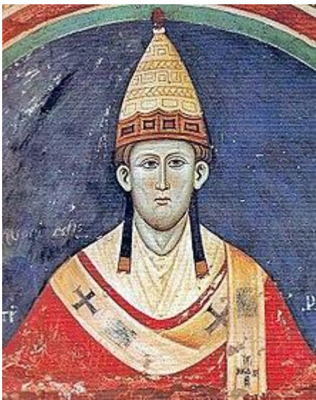
Un affresco coevo di Papa Innocenzo III .

I ribelli fecero un giuramento e chiesero che il re confermasse lo Statuto delle libertà proclamato dal re Enrico I nel secolo precedente, e che venne redatto per proteggere i diritti dei baroni. [11][12][13] La forza dei ribelli era insignificante per gli standard del tempo, tuttavia erano tutti uniti dal loro odio verso il re; [14] Robert Fitzwalter , in seguito eletto al comando dei baroni ribelli, affermò pubblicamente che Giovanni avesse tentato di violentare la figlia, [15] e fu implicato in un complotto per assassinarlo nel 1212. [16]