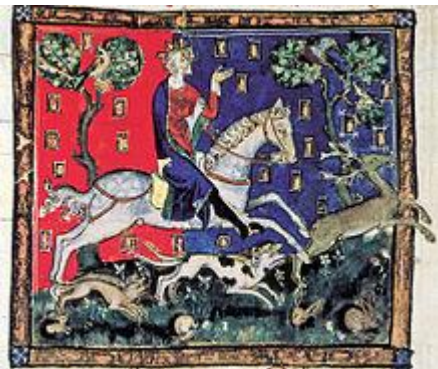
Re Giovanni d'Inghilterra durante una caccia al cervo .

La Magna Carta venne concepita, nel 1215, come un tentativo non riuscito di raggiungere la pace tra i monarchici e le fazioni ribelli, come parte degli eventi che portarono allo scoppio della prima guerra dei baroni . A quel tempo l' Inghilterra era governata da re Giovanni , il terzo dei re degli angioini . Nonostante il regno avesse un sistema amministrativo robusto, la natura del governo sotto la dinastia angioina fu mal definita e incerta. [2] Giovanni e i suoi predecessori governarono con il principio della vis et voluntas (o "forza e volontà"), in cui i regnanti godevano di potere esecutivo e potevano talvolta prendere decisioni arbitrarie, spesso giustificando tali azioni sulla base che un re era al di sopra della legge. [3] Molti scrittori coevi ritennero che i monarchi avrebbero dovuto governare in accordo con il costume e con la legge, insieme al consiglio dei membri più importanti del regno, ma non vi fu alcuna regola per quello che sarebbe dovuto accadere se un re si fosse rifiutato di farlo. [3]