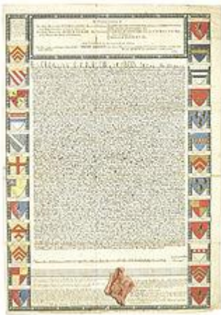
Incisione della Carta del 1215, realizzata nel 1733 da John Pine

Un primo tentativo per una vera e propria storiografia venne intrapreso da Robert Brady , [147] il quale confutò la presunta antichità del Parlamento e credette nella continuità immutabile della legge. Brady si rese conto che le libertà della Carta sono erano limitare e sostenne che fossero una concessione del re. Ponendo la Magna Carta nel contesto storico, instillò il dubbio circa la sua rilevanza politica contemporanea, [148] la sua comprensione storica non sopravvisse alla Gloriosa Rivoluzione , che, secondo lo storico JGA Pocock, "ha segnato una battuta d'arresto nel corso della storiografia inglese." [149]